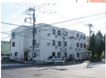
2020 年オープン みらいえ相模原千代田