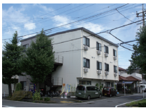
2016 年オープン みらいえ相模原中央