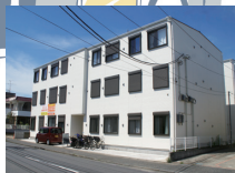
2021 年オープン みらいえ相模原共和